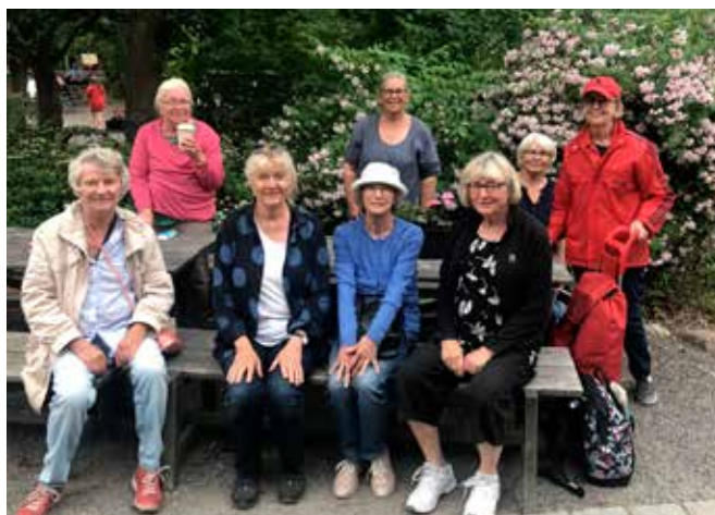
Vi som var där.