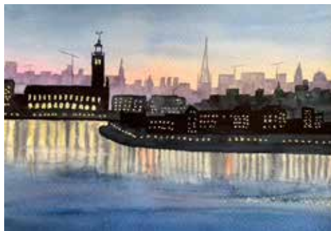
Beatrice Juhlin-Danfelt: Skymning över staden.