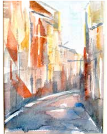
Karin Lagerberg: En gränd i Gamla stan.