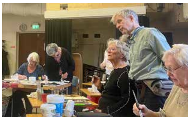
Text: Gunilla Tuvin