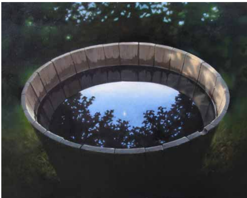
Kärl, oljemålning av Anna Toresdotter

Anna Toresdotter visar och demonstrerar bland annat hur skuggorna bygger upp ljuset i bilden, hur ljusets färg avgör skuggans färg och hur bakgrunden kan förstärka ljuset i förgrunden.