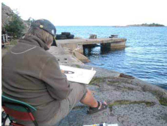
Härliga, inspirerande vyer...

Vandrarhemmet var rymligt och trevligt. Några andra hus fanns i samma regi. En skolklass med barn och några föräldrar från en skola i Danderyd var också på plats. Barnen var artiga och så gulliga. De hade en massa fartiga tävlingar, badade mycket och verkade så glada över att få vara tillsammans. Vi var också glada över att få vara tillsammans, njuta av den vackra ön, det härliga sensommarvädret och att få vara ute och måla!