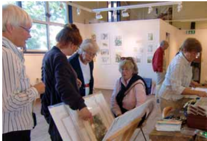
Fullaktivitet under hängningen

Många aktiva "gamla" Sprayare uppmärksammades