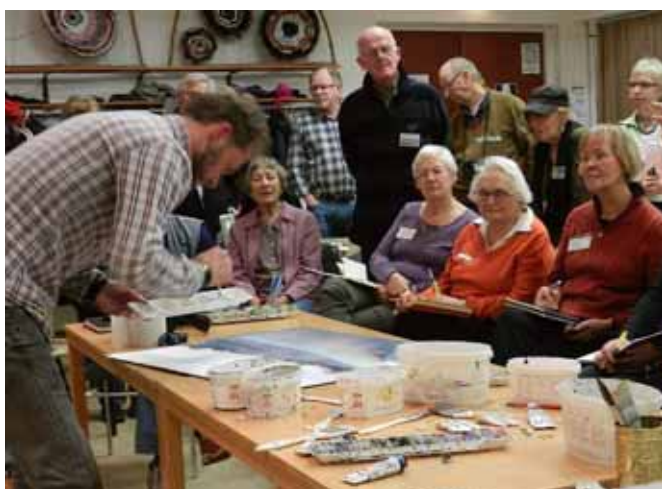
Detaljerna målas med pensel eller med färgtubens gänga